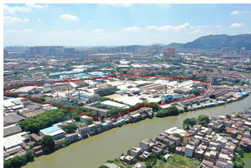
佛山聯新舊廠項目

未來，奧園將繼續深耕粵港澳大灣區，通過城市更新改造將產業轉型升級、城市擴容提質和居住環境優化緊密結合。